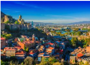
Tbilissi (Géorgie) 📍