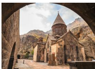
Erevan 📍 🚗 40km - ⌚ 1h