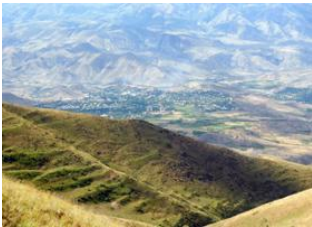
Eghegnazor 📍 Hermon 📍